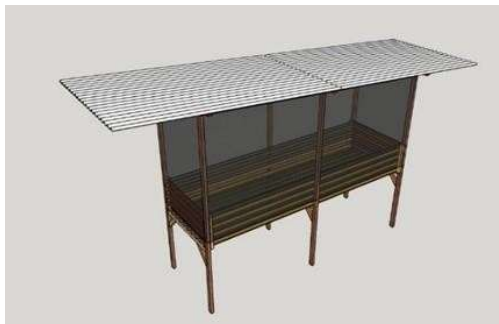
Figura 3. Minhocário