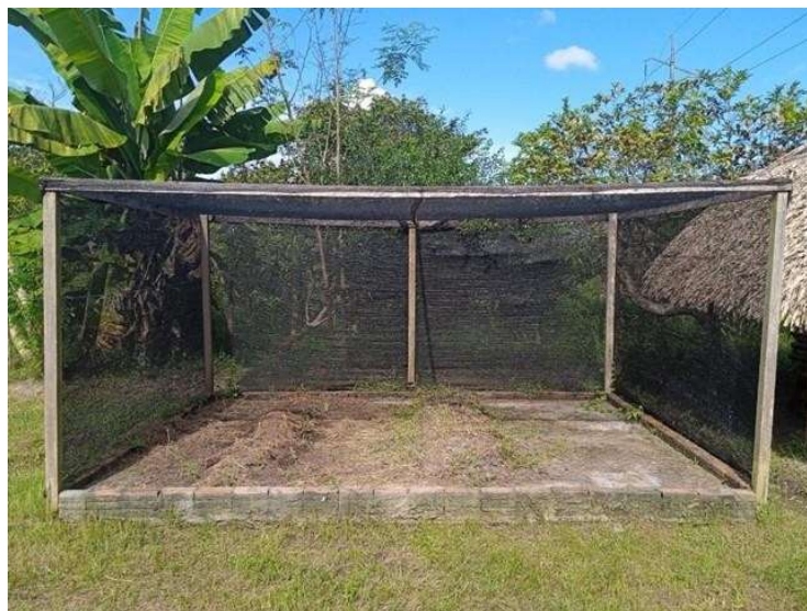
Figura 2. Composteira

- A composteira deverá ter uma área de abrigo dos compostos orgânicos de 11,89m 2 , com cobertura de 1,90m, cada composto corresponde geometricamente a um trapézio, com dimensões de 2,10m de base maior; 1,45m de base menor; 1,00m de largura, altura de 0,70m e com inclinação de aproximadamente 40°); as colunas de sustentação deverão ser de concreto, moldadas em tubos de PVC de 75 mm; a cobertura deve ser de tela sombrite 50% nas três laterais e no teto, conforme Figura 2.