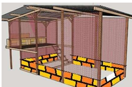
Figura 1. Galinheiro

- os ninhos devem ser colocados pelo menos a 0,6m acima do piso, em número mínimo igual a três. As medidas de cada ninho devem ser: 0,4m de largura, 0,30m de profundidade e 0,30m de altura. Devem ter tampa articulada para retirada dos ovos pelo lado externo do galinheiro, conforme Figura 1 e detalhes na Figura 2.